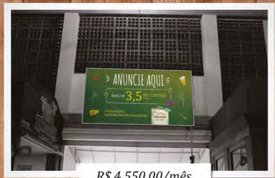
Painel Portão E – Saída