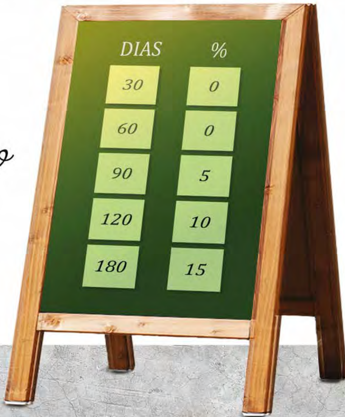
Tabela de Desconto Progressivo