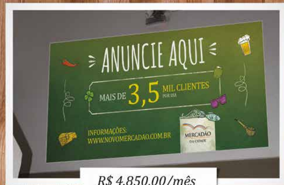
Painel Escada - Subsolo