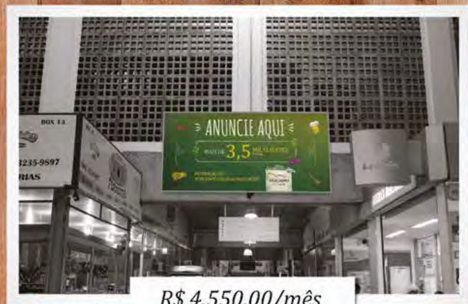
Painel Portão E – Entrada