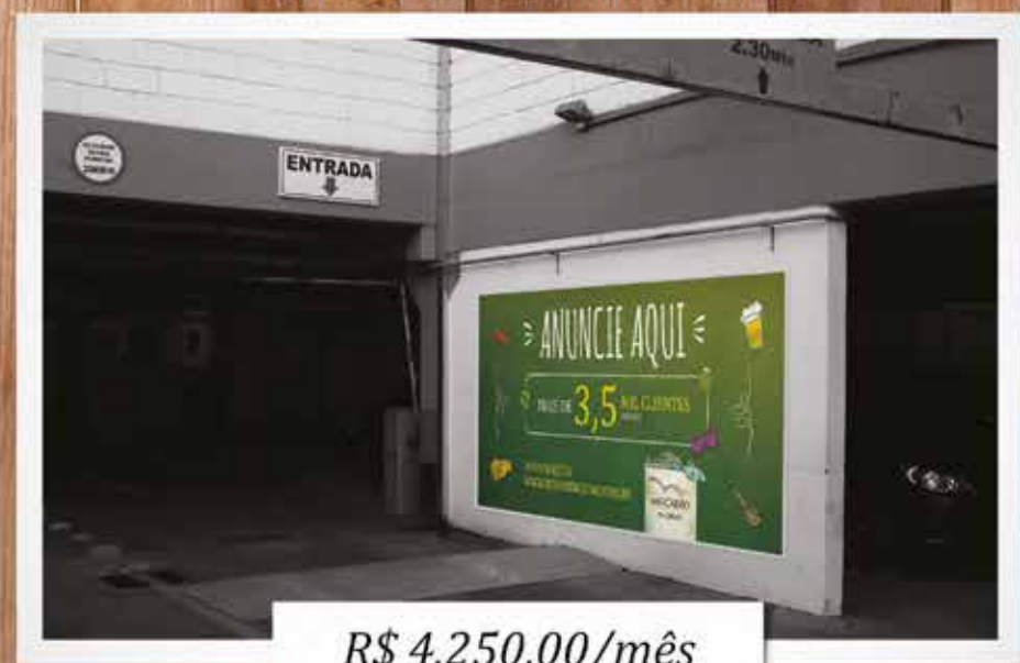
Painel Estacionamento - Saída