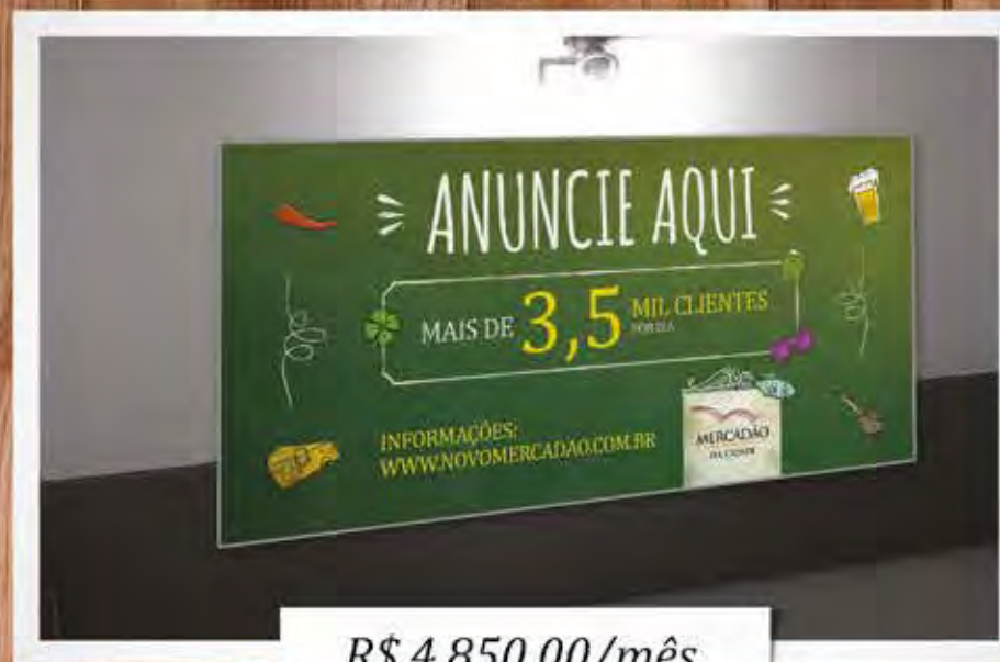
Painel Escada – Solo