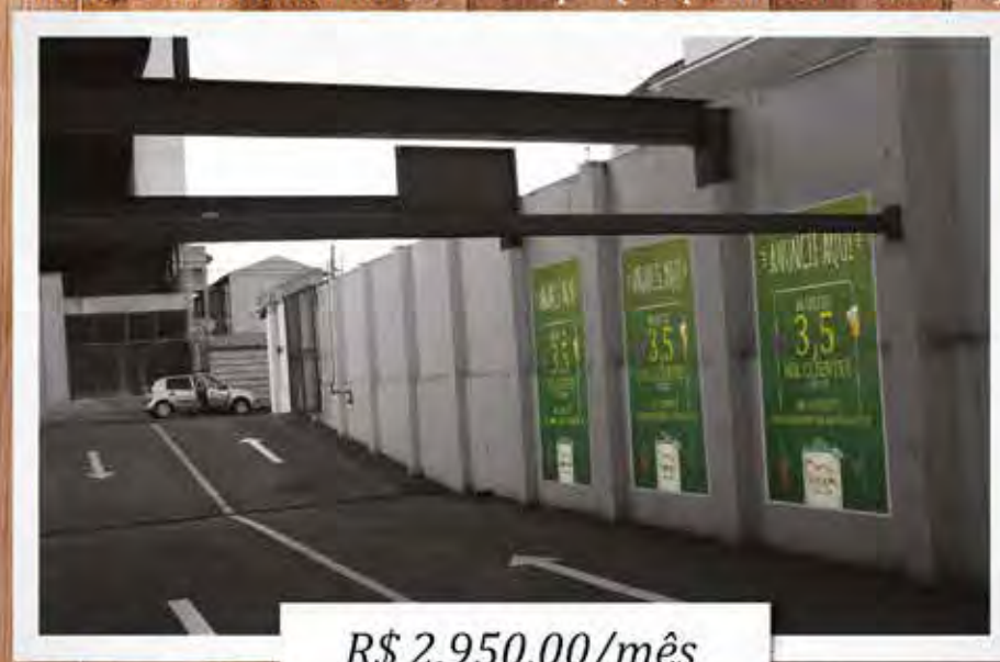
Painel Estacionamento – Rampa (Sequencial – 1, 2 e 3)