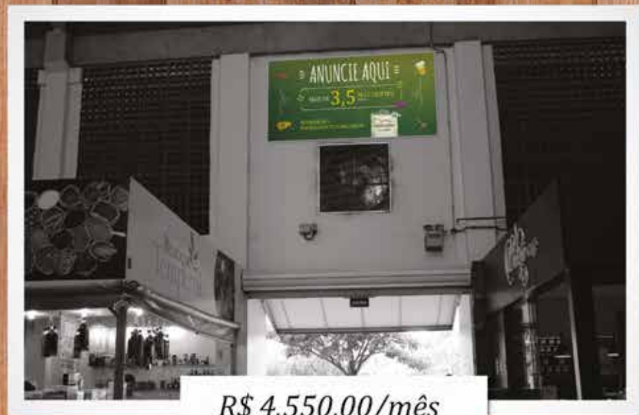
Painel Portão A - Saída