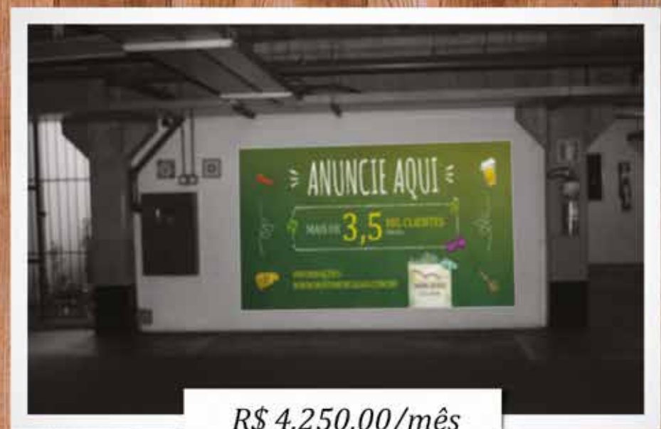
Painel Estacionamento - Portaria